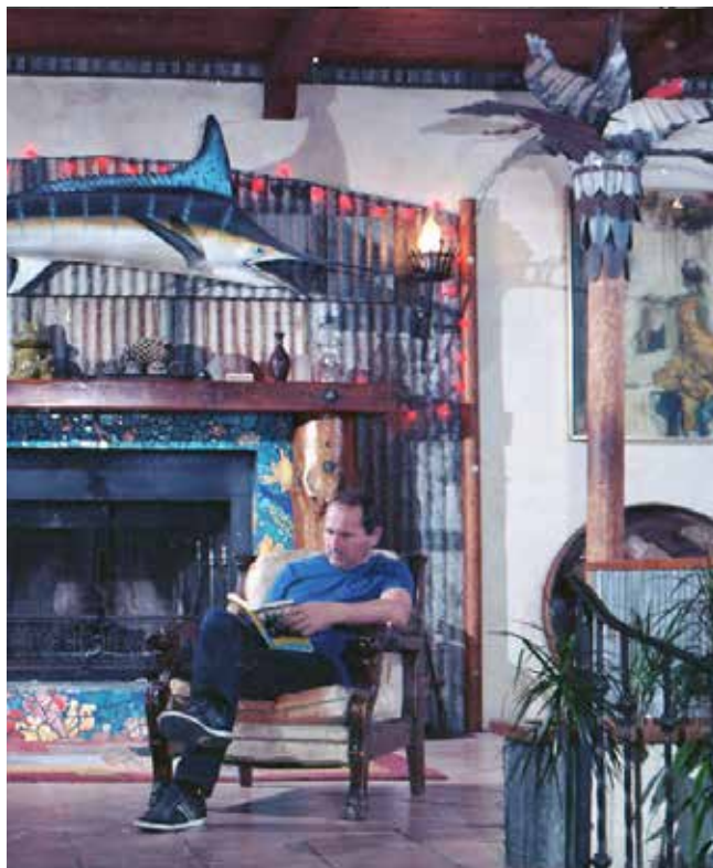
De auteur in Topanga Canyon, 2016